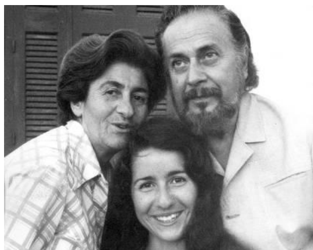
Ο ποιητής με τη σύζυγο και την κόρη του