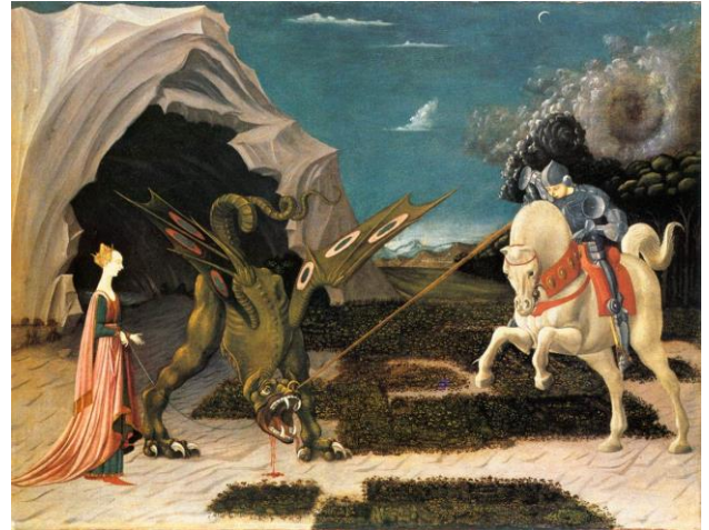
Paolo Uccello, «Ο Άγιος Γεώργιος και ο Δράκος» 1470 μ.Χ., Εθνική Πινακοθήκη Λονδίνου