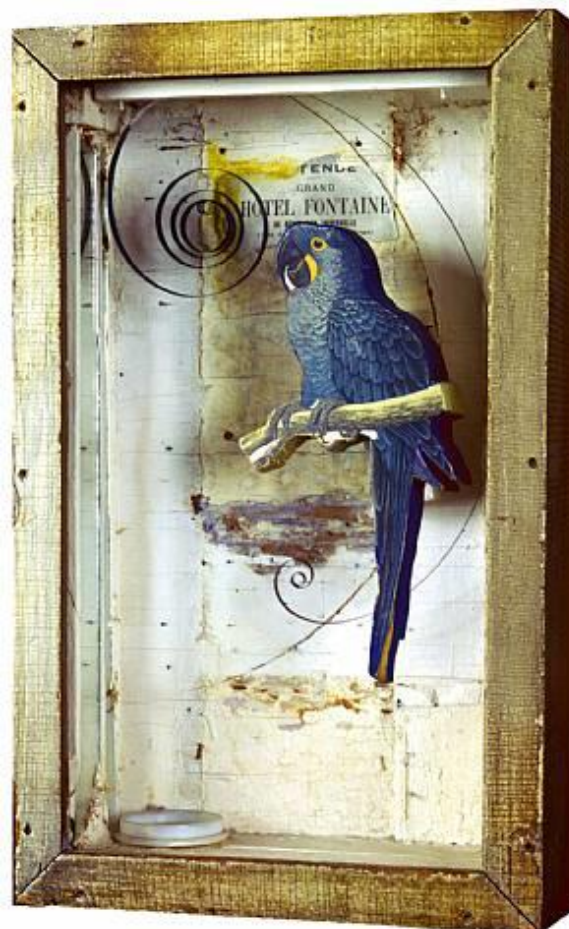
Οι άγγελοι του Κίβι, Τζόζεφ Κορνέλ