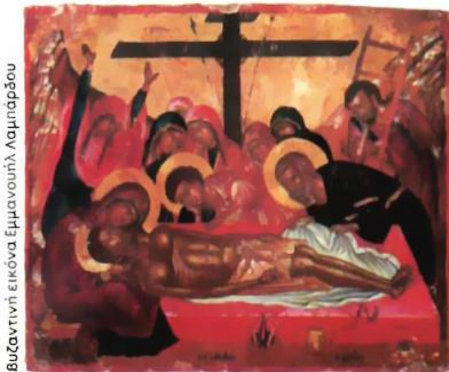
Βυζαντινή εικόνα Εμμανουήλ Λαμπάρδου

Η Μαριάμ ένιωσε πως κάποιος μπήκε στην αυλή της, κι ανοίγοντας τα μάτια, είδε μπροστά της τον Ιωάννη, που ανάσαινε με κομμένη αναπνοή και μιλούσε με την ψυχή στα δόντια.