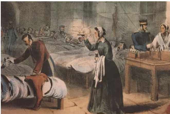
(πάτησε στη φωτογραφία για να μάθεις περισσότερα για αυτή)

Η υγεία είναι ένα από τα βασικά ανθρώπινα δικαιώματα και κάθε άνθρωπος σε κάθε σημείο του πλανήτη πρέπει να έχει πρόσβαση σε ποιοτικές υπηρεσίες υγείας, ανεξαρτήτως της οικονομικής του κατάστασης. Ωστόσο, στις φτωχές χώρες του κόσμου, οι υπηρεσίες υγείας υπολειτουργούν με αποτέλεσμα οι άνθρωποι να εκτίθενται σε κινδύνους και να χάνουν τη ζωή τους. Η Καθολική Κάλυψη Υγείας μέχρι το 2030, είναι το ζητούμενο για όλα τα κράτη-μέλη του ΟΗΕ, στο πλαίσιο των στόχων της αειφόρου ανάπτυξης.