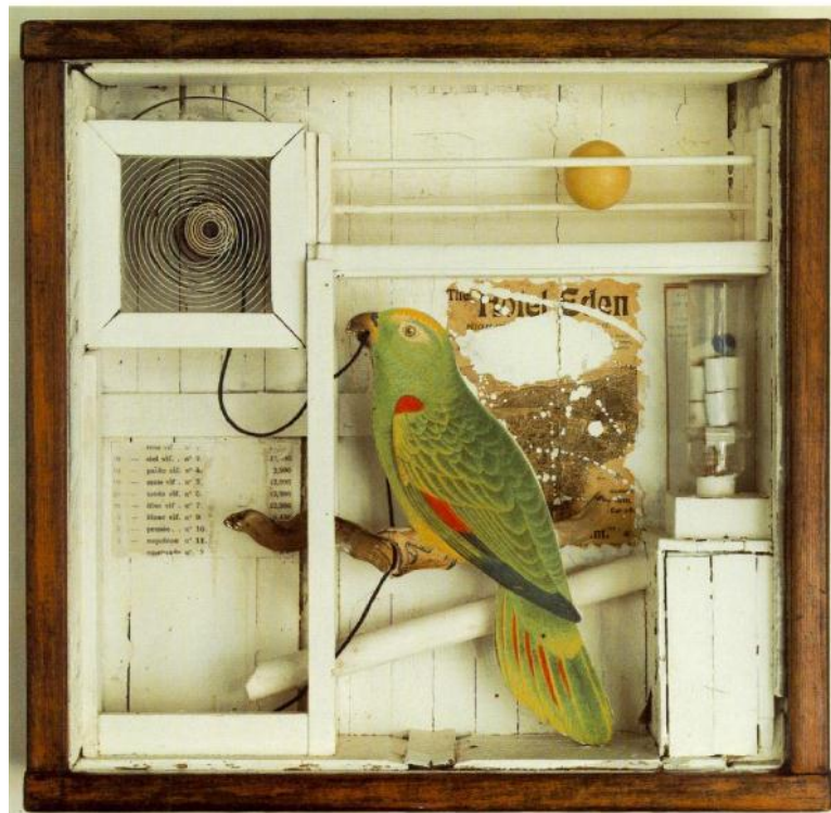
Το ξενοδοχείο Εδέμ, Τζόζεφ Κορνέλ