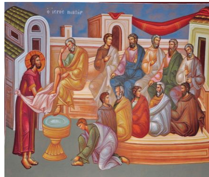
Μεγάλη Πέμπτη (πρωί)