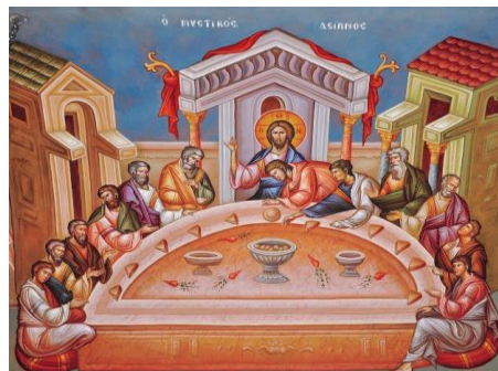
Ο Μυστικός Δείπνος

Τη Μεγάλη Πέμπτη το βράδυ είναι η Σταύρωση του Χριστού. Σχεδιάσε στο τετράδιό σου ένα δικό σου στεφάνι με λουλούδια , που θα ήθελες να τοποθετήσεις πάνω στον Εσταυρωμένο Ιησού.