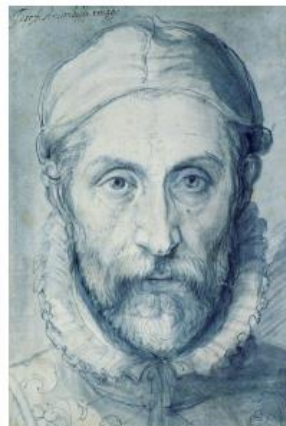
Τζουζέπε Αρτσιμπόλντο, «Αυτοπροσωπογραφία», 1570

https://www.youtube.com/watch?v=hrHZL8pp-M http://paixnidismata.weebly.com/arcimboldo.html