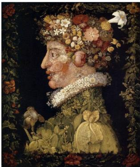
Τζουζέπε Αρτσιμπόλντο, "Άνοιξη" (1563), λαδομπογιά, 66Χ50 εκ.