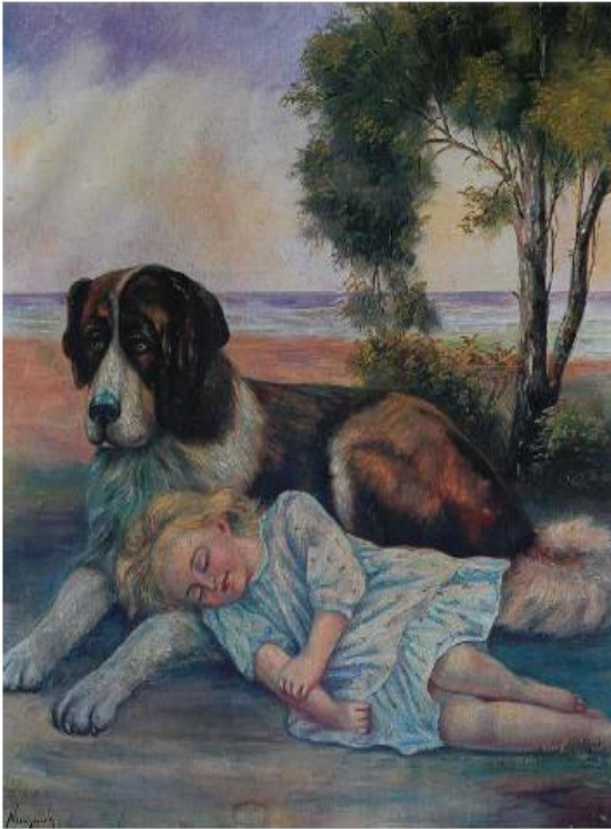
Νίκος Νικολαΐδης, «Ο σκύλος με το κοριτσάκι», λαδομπογιά.

Πάτησε στον ακόλουθο σύνδεσμο (σελίδες 8-9)