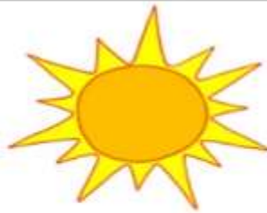
5. λιακάδα- ηλιοφάνεια