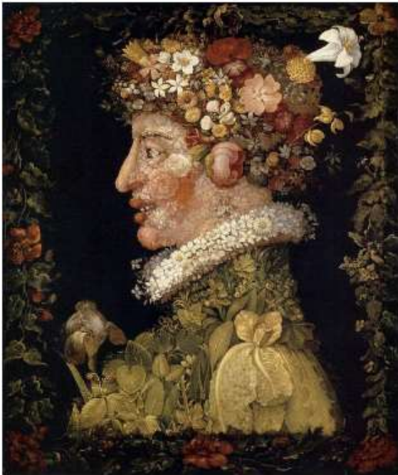
Τζουζέπε Αρτσιμπόλντο, "Άνοιξη" (1563), λαδομπογιά, 66Χ50 εκ.