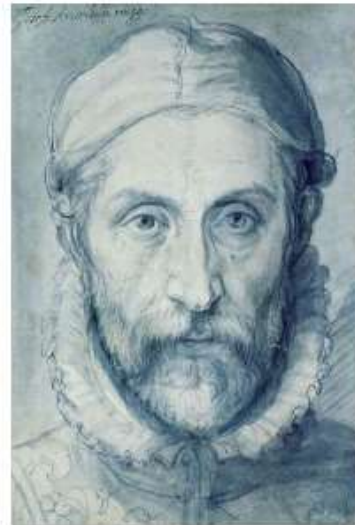
Τζουζέπε Αρτσιμπόλντο, «Αυτοπροσωπογραφία», 1570

https://www.youtube.com/watch?v=hrHZL8pp--M