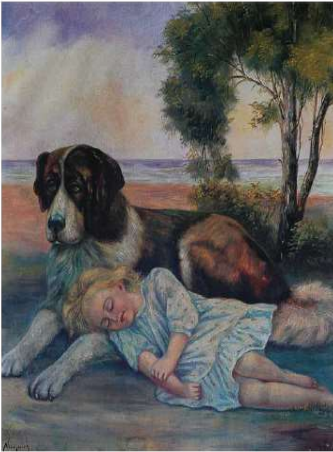
Νίκος Νικολαΐδης, «Ο σκύλος με το κοριτσάκι», λαδομπογιά.

Πάτησε στον ακόλουθο σύνδεσμο (σελίδες 8-9)