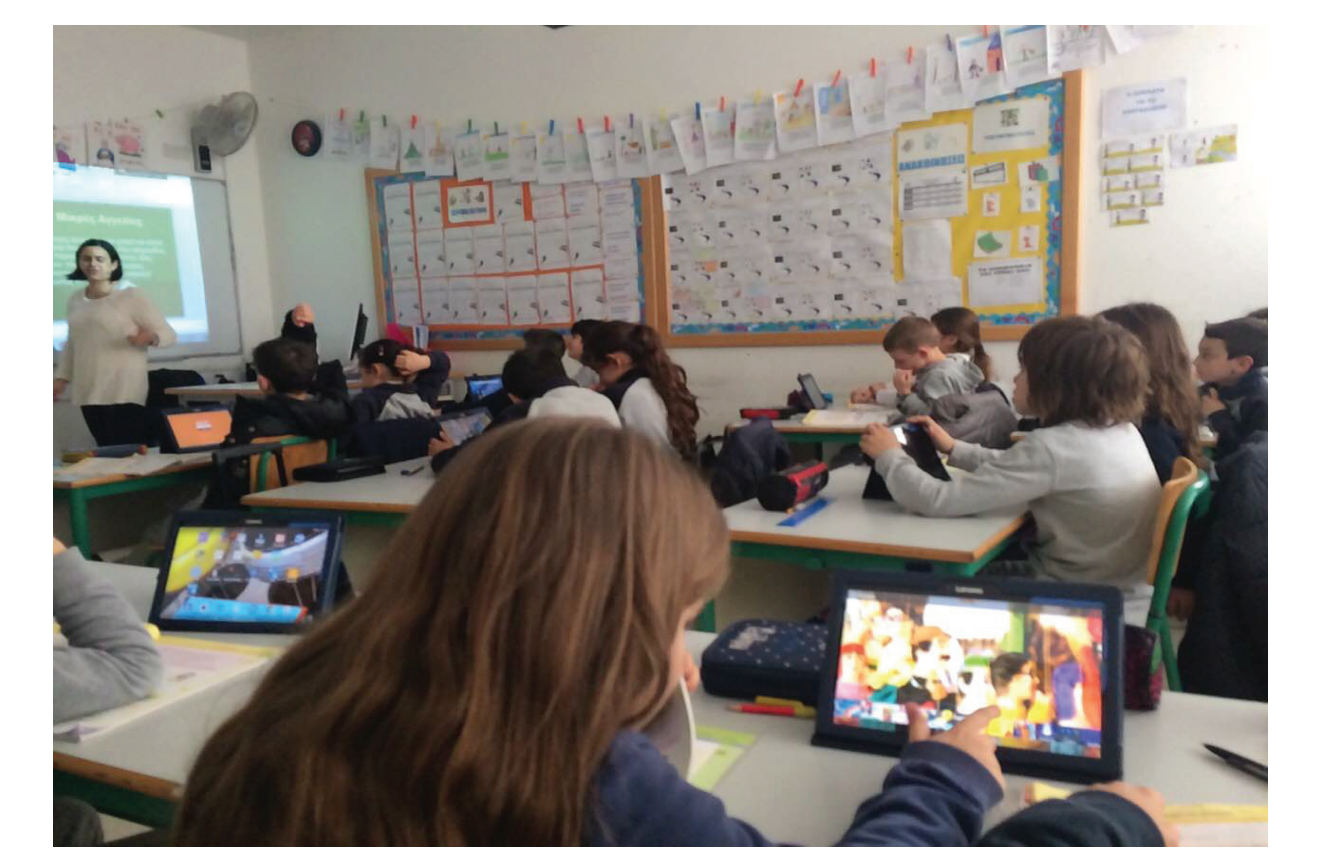
ΧΡΗΣΗ ΕΦΑΡΜΟΓΩΝ ΜΕΣΩ TABLETS